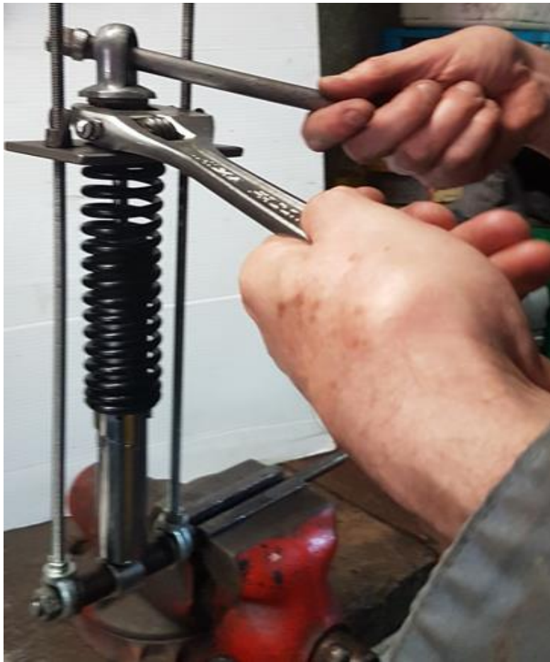
Déblochage de l'écrou (pièce 3)