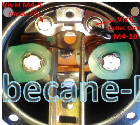
Montage de la platine vibreur et de la cosse extérieure