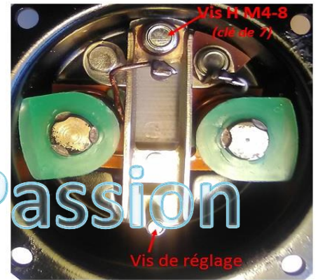
Vibreur monté, attention à l'alignement des contacts