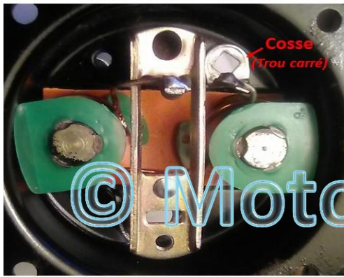
Intérieur du klaxon démonté